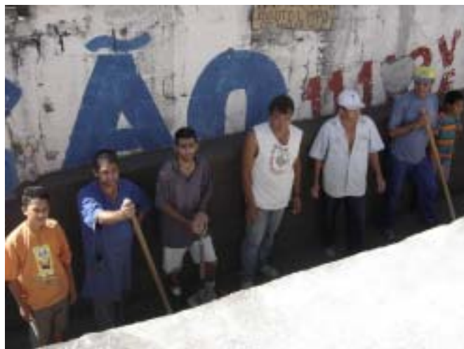
Moradores durante o mutirão de canalização do esgoto

Enquanto a Rainha da Paz luta para fazer funcionar a padaria comunitária, os moradores da Maracanã não ficam de braços cruzados. Ao mesmo tempo em que se organizam para a realização de um mutirão de limpeza e canalização de um esgoto no beco onde futuramente funcionarão a padaria comunitária e uma creche, eles se reúnem para receber representantes da Sub Prefeitura, formular reivindicações e cobrar que os governos cumpram suas promessas.