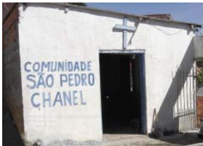
Igrejinha onde os moradores se reúnem na Maracanã

Boa leitura e tomara que todos gostem do nosso jornal, pois ele foi feito especialmente pra vocês, e qualquer dúvida ou crítica, é só nos procurar na Associação Rainha da Paz - Rua Aderbal, 20 - Jd. Fim de Semana - ou entrar em contato pelo nosso e-mail: falafavela@terra.com.br