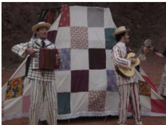
Os ManiCômicos começam a contar...