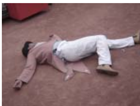
... ZÉÉÉ VARGEM!!!