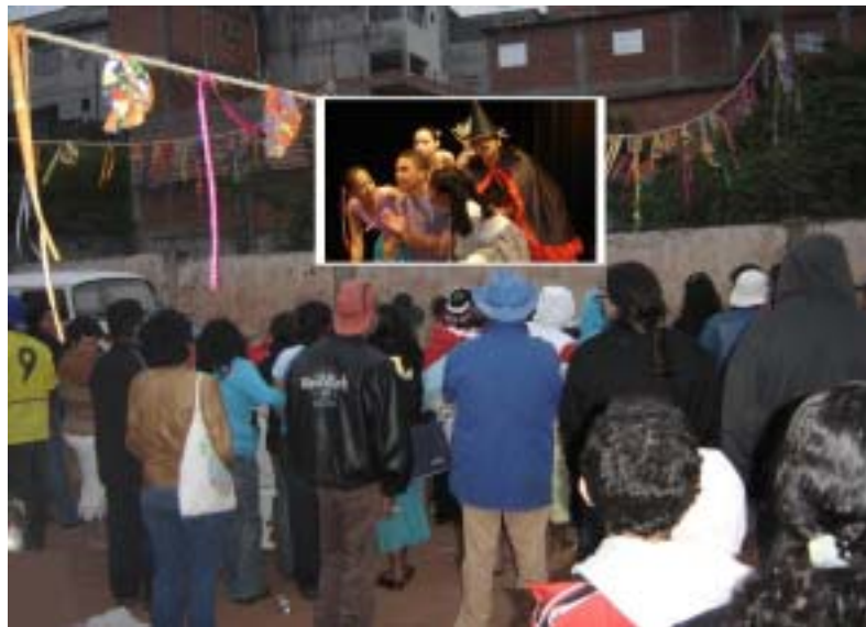
Cinema no Campinho da Primo Morati

Se você não pôde comparecer, lamentamos informar que perdeu um daqueles momentos em que a Favela deixa de ser vista como um lugar violento e negativo e passa a ser um motivo de orgulho e alegria. Foram quatro horas de uma tarde inesquecível, de muita festa e alegria.