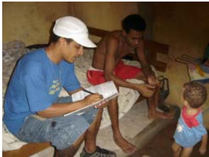
Visita mensal a uma família do 'Fofinhos'

Eles trabalham para o bem estar de toda comunidade e isso não é tarefa fácil, pois, faça chuva ou faça sol, eles têm que cumprir sua missão: