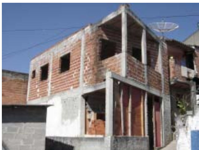
Prédio onde funcionará a Padaria Comunitária

Concluir esta obra e implantar este projeto é o papel e o desafio da Associação Rainha da Paz. As dificuldades fazem parte do processo e temos certeza de que, em breve, muitos jovens da Maracanã, da Fim de Semana, do Capelinha e do Campo de Fora estarão sendo capacitados para terem uma profissão, um trabalho digno, além de estarem ajudando a produzir alimentos mais baratos para a comunidade. Além dessa, muitas outras coisas boas estão acontecendo no Jardim Maracanã, frutos do desejo e da participação dos moradores. Vejam a seguir.