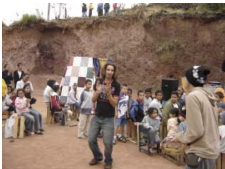
O grupo Berinjela Music mandando um repente...

Alguns momentos da Festa Cultural do último dia 3 de setembro: