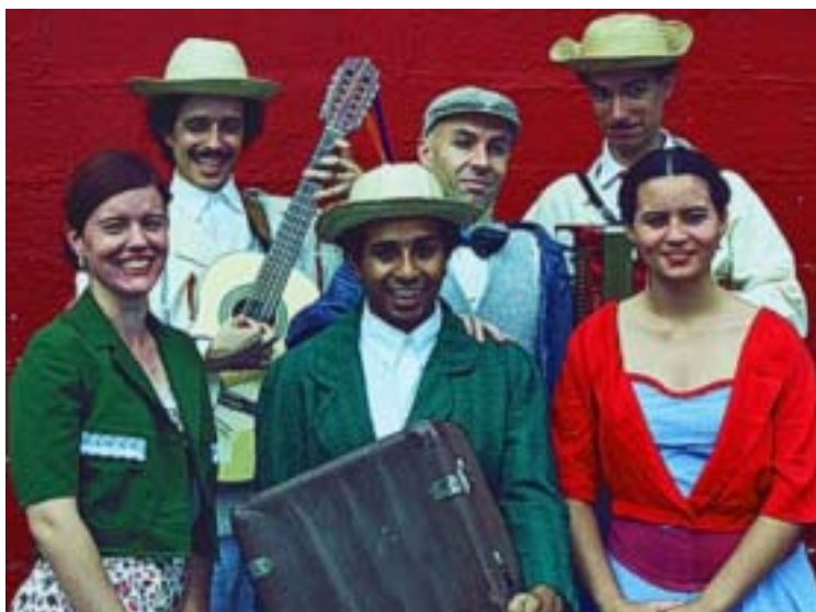
A Cia Teatral ManiCômicos na peça KAOSU