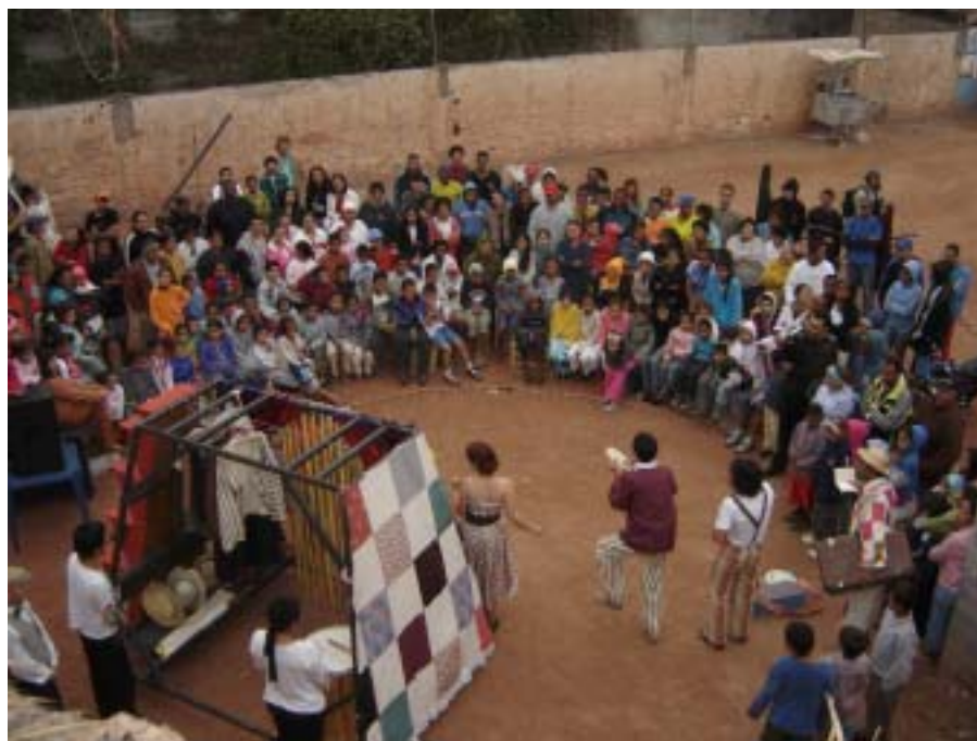
Enquanto o público se aperta para não perder nenhuma cena.