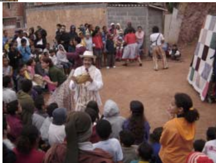
... a incrível e engraçada história de...