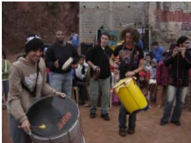
... e muita música brasileira para alegrar a festa